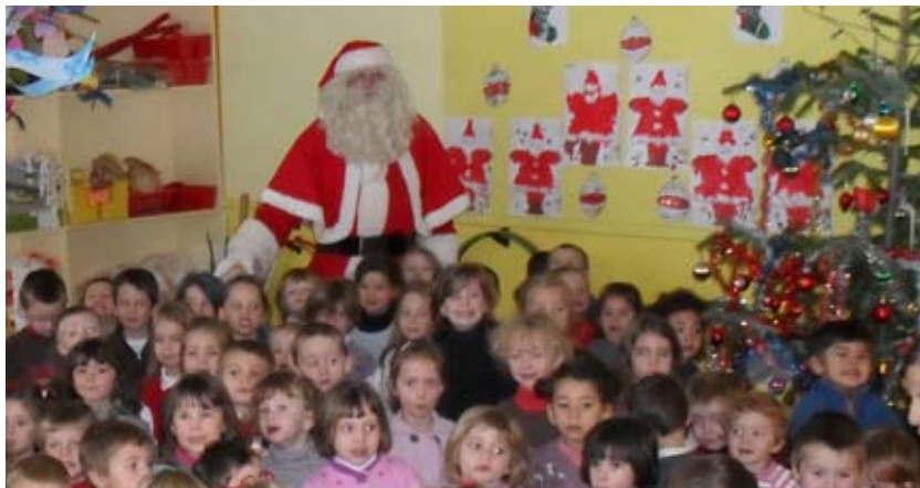
Les enfants de l'école maternelle et le Père Noël