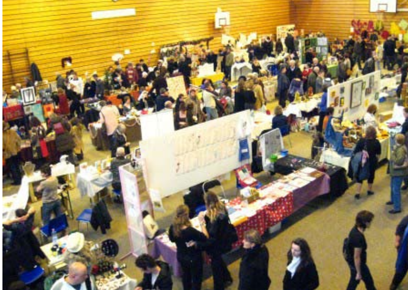
Le marché de Noël

Cette année encore, les visiteurs ont pu découvrir dans les allées du marché plusieurs dizaines de stands où ils pouvaient contempler les produits artisanaux mais aussi satisfaire leurs papilles de spécialités gastronomiques.